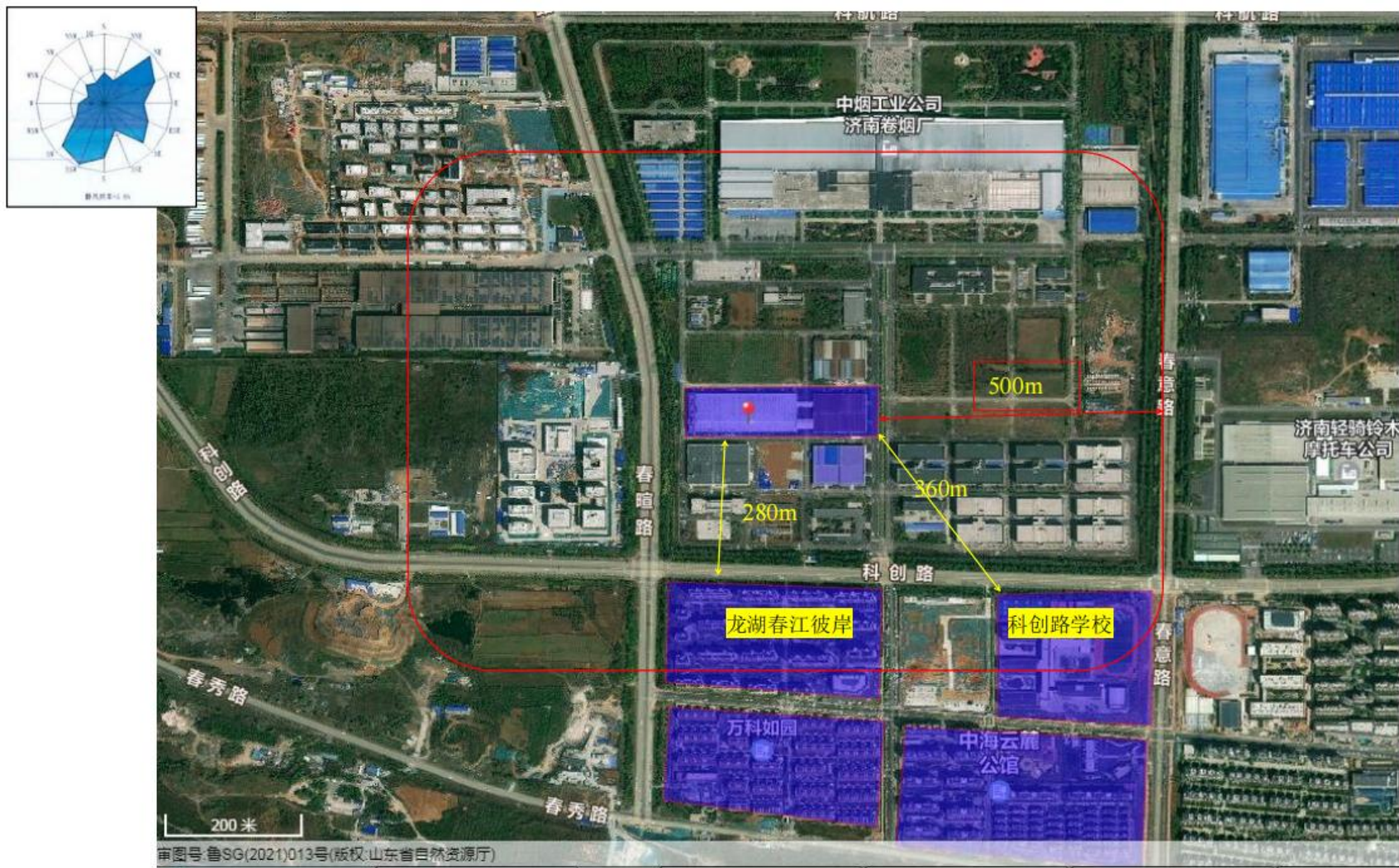
附图2 项目周边情况图