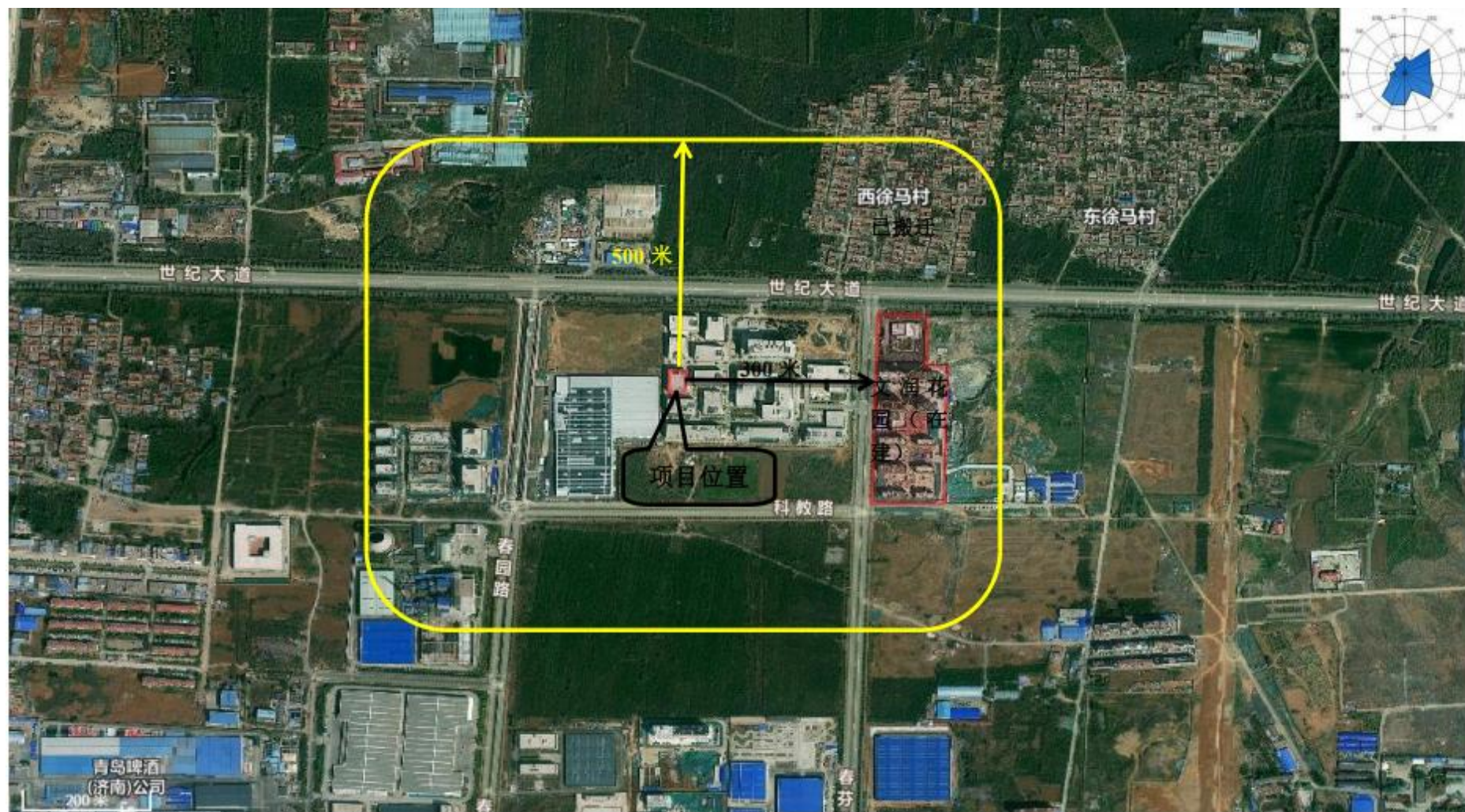
附图2 项目周边情况图