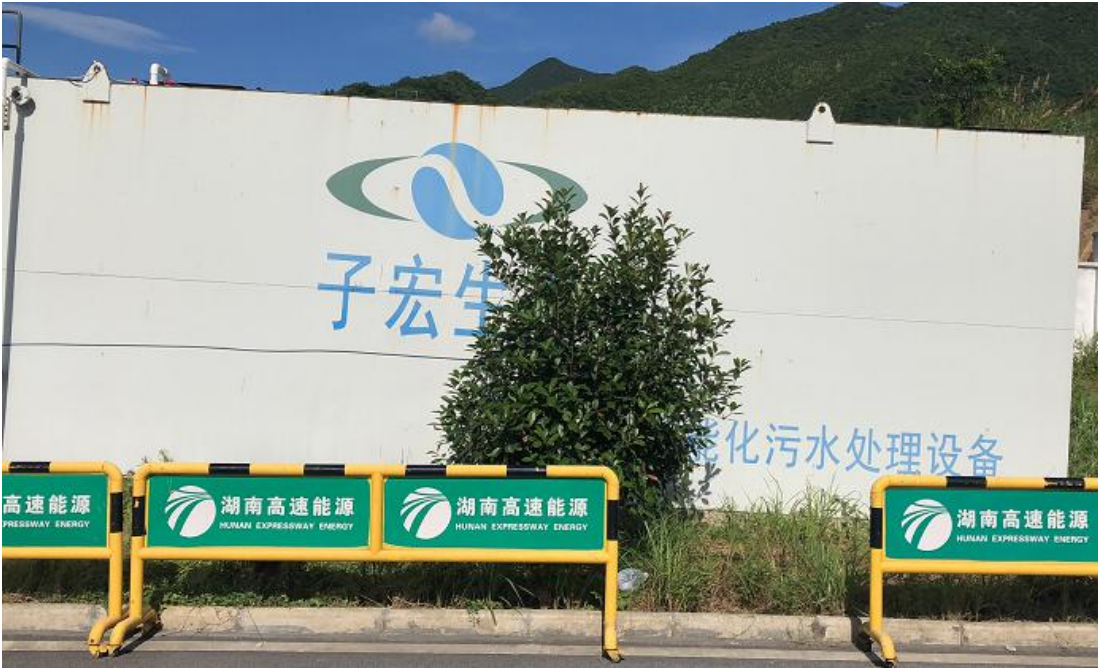
北区服务区污水处理站