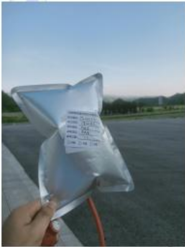
无组织废气采样照片