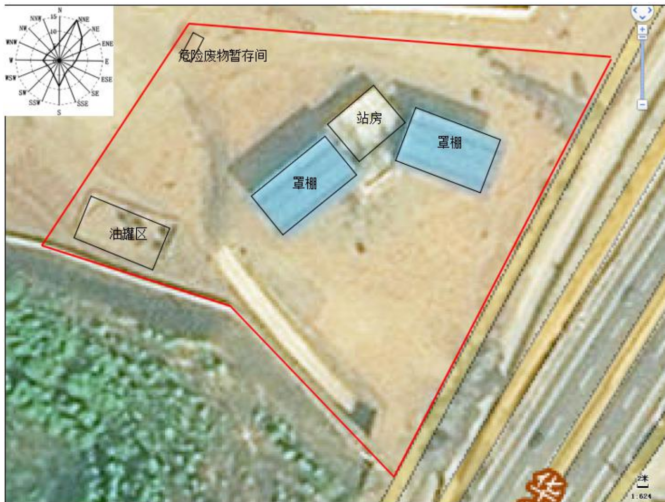
附图 2：项目平面布置图