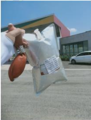
无组织废气采样照片