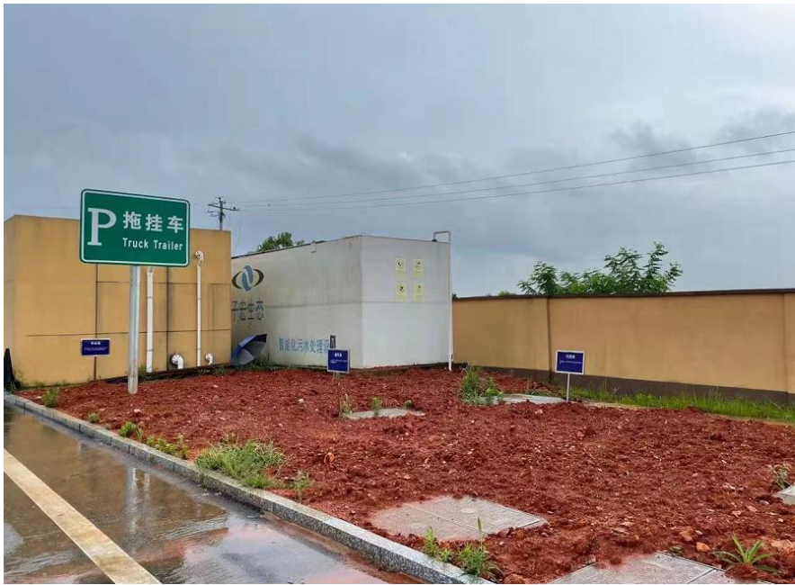
西服务区污水处理站