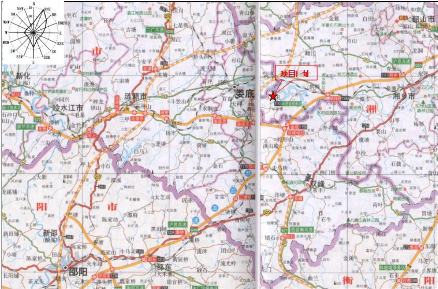
附图1 项目地理位置 比例尺1:800000