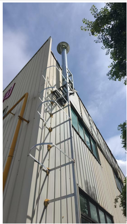
DA002 燃料燃烧废气排放口（时效处 理工序）