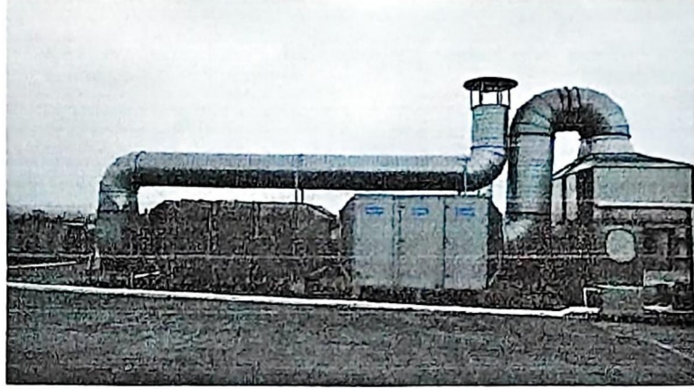
1套“水喷淋+脱水除雾装置(水喷淋装置配套)+二级活性炭吸附装置”1#