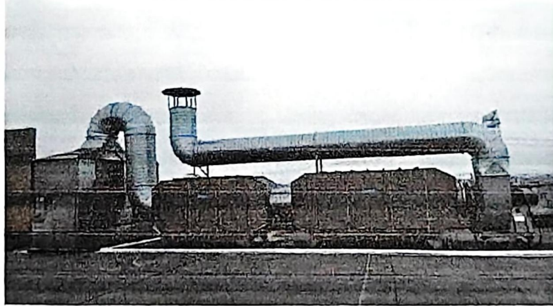
1套“水喷淋+脱水除雾装置(水喷淋装置配套)+二级活性炭吸附装置”2#