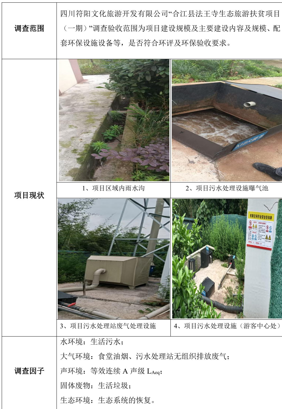
表二 调查范围、因子、目标、重点