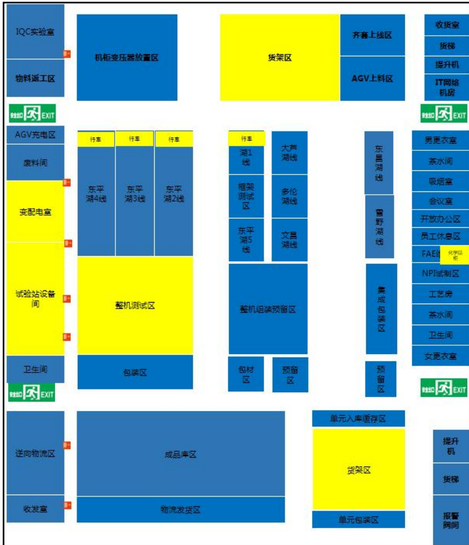
附图3-2 项目工程传动车间1F平面布置图