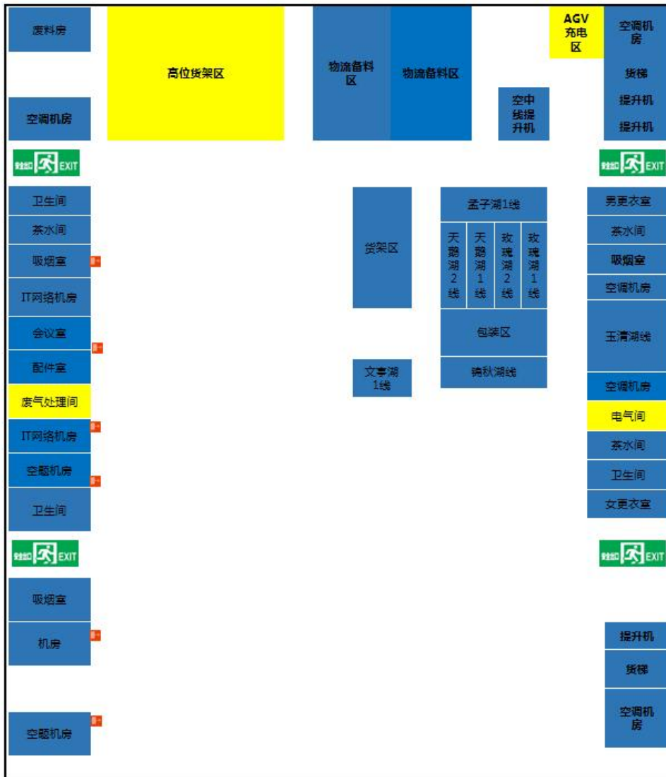
附图3-5 项目大传动车间2F平面布置图