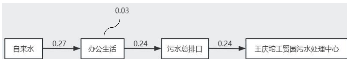
图 3.4-1 本阶段项目水平衡图 (单位: m 3 /d)

本阶段验收内容无生产废水产生，员工新增 4 人，生活污水经化粪池处理后排入王庆坨工贸园污水处理中心进一步处理。