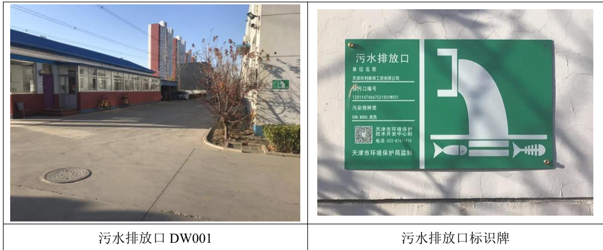
图 4.1-2 废水排出口照片