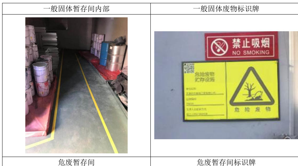
图 4.1-3 本阶段项目固体废物暂存场所