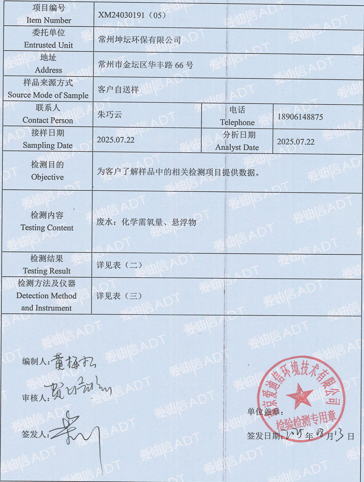
表 (一) 项目概况说明