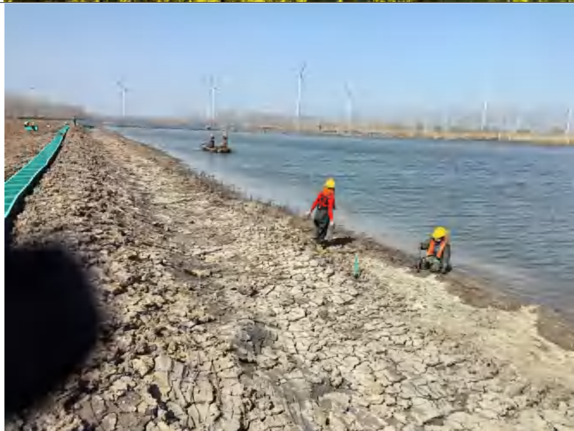
退圩湖区近岸边青苇种植