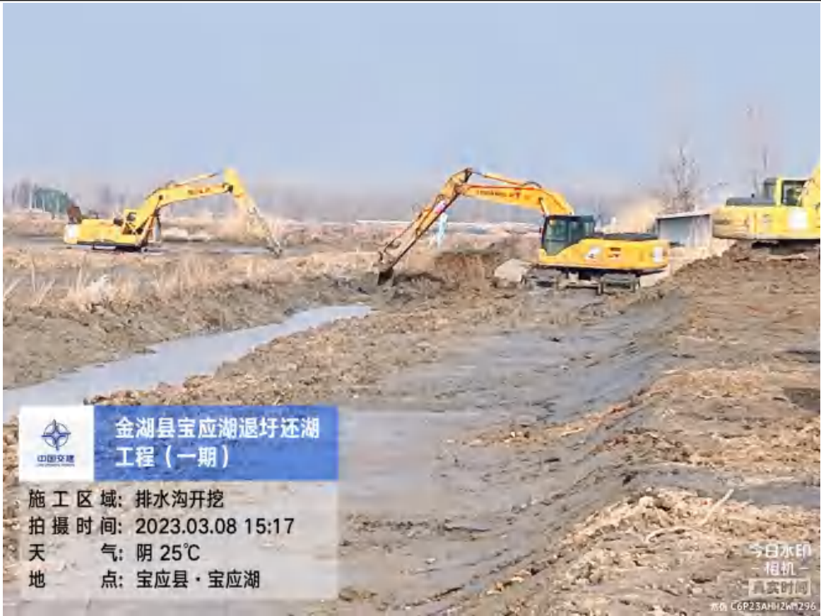
排水沟开挖与修整