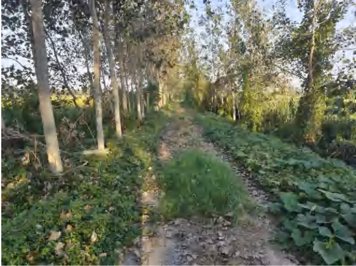
农田周边道路建设