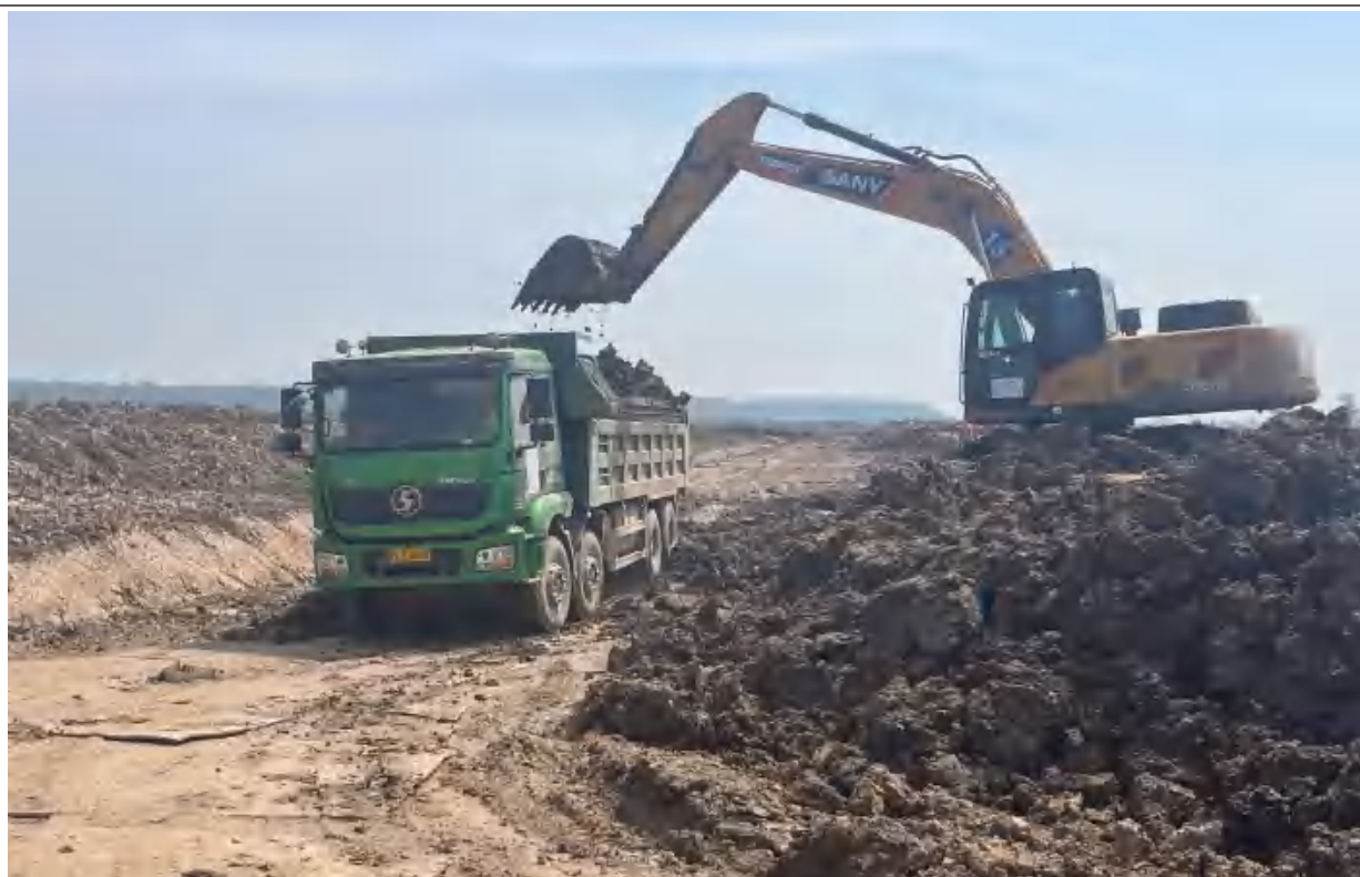
采用可密闭车辆运输、车辆不满载