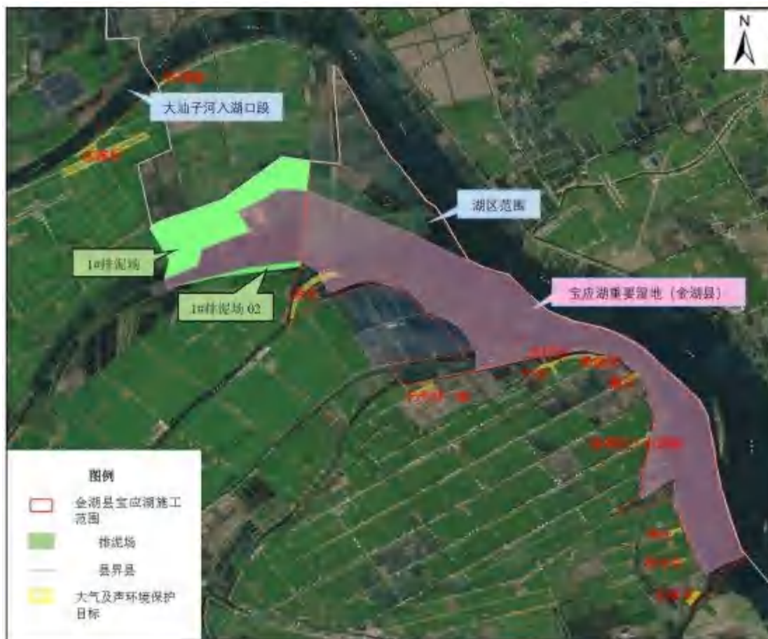
图 2.6-1 大气及声环境保护目标图