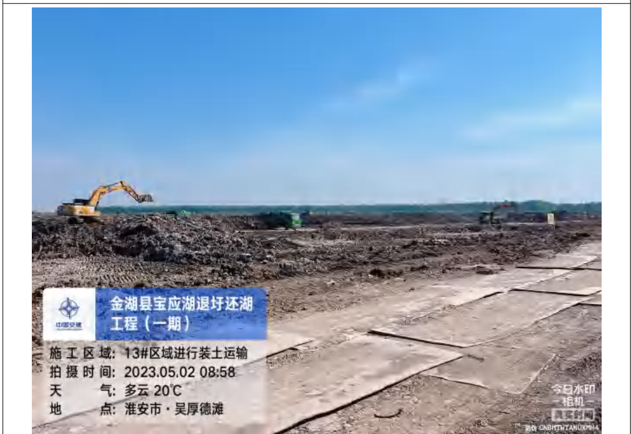
开挖土方及时分类回填