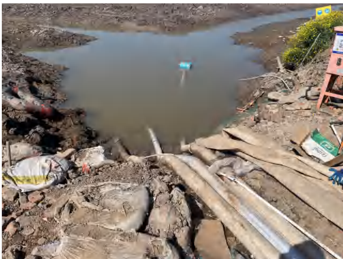
养殖水排入周边河道，未直接排入宝应湖