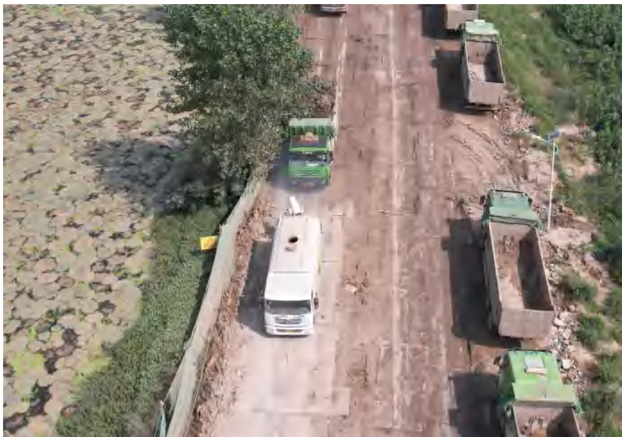
施工现场定期洒水