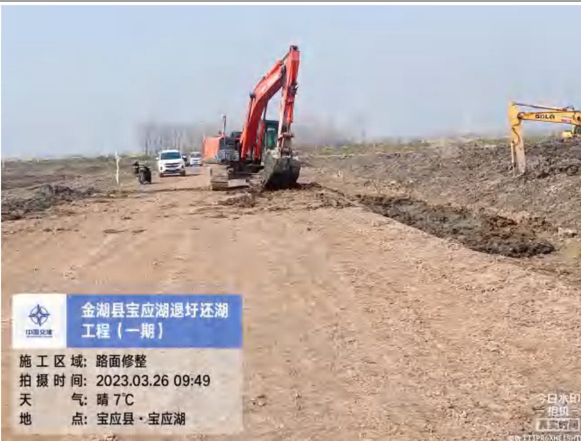
道路压实、加宽和修整