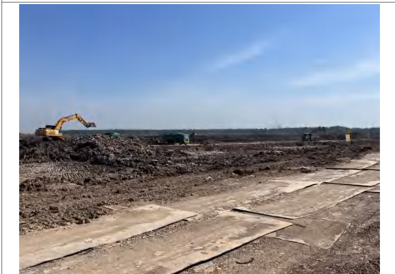
合理规划施工区域，重型设备不集中施工