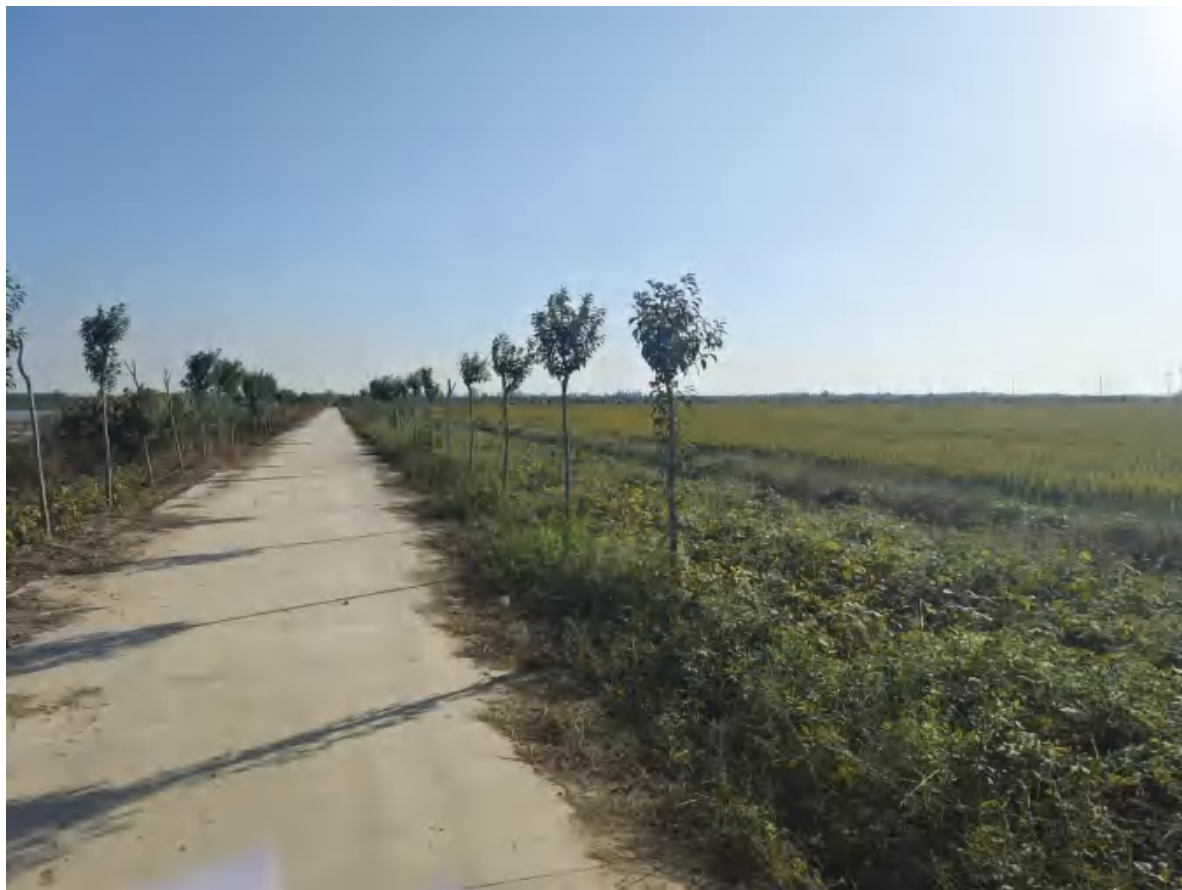
自由湖面周边和排泥池周边植被现状