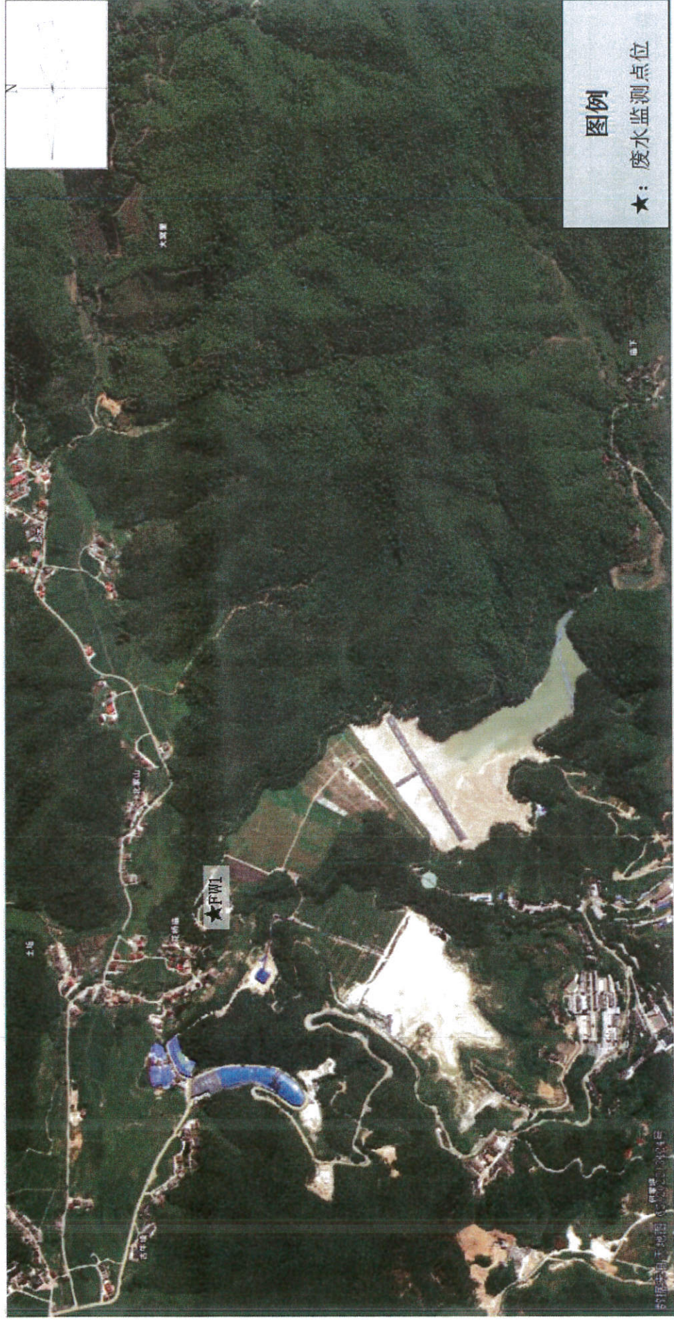
附图：监测点位示意图