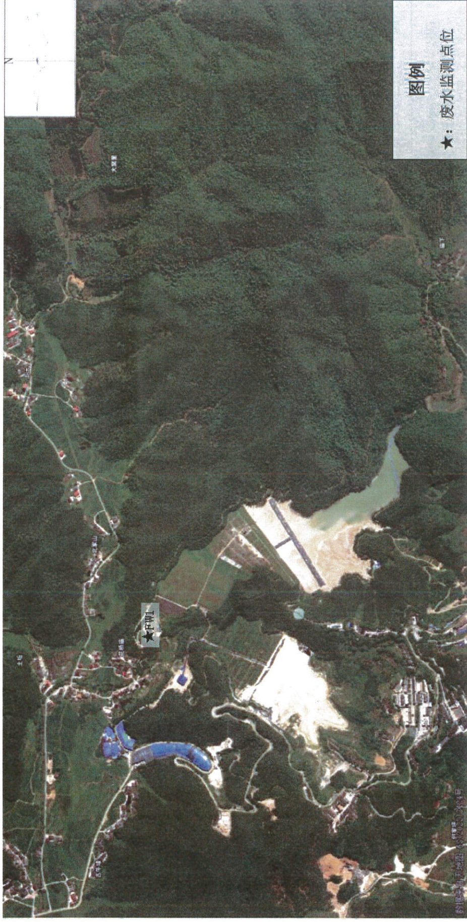
附图：项目监测点位示意图