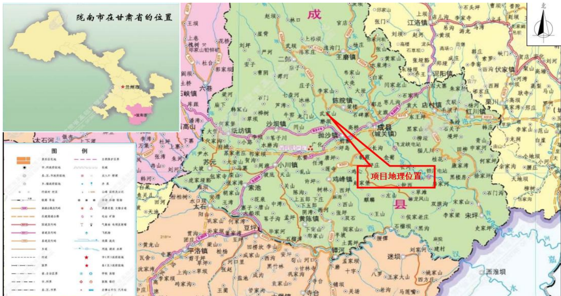
图1 项目地理位置图