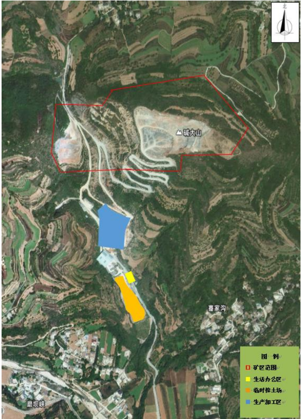
图2 项目矿区平面布置图