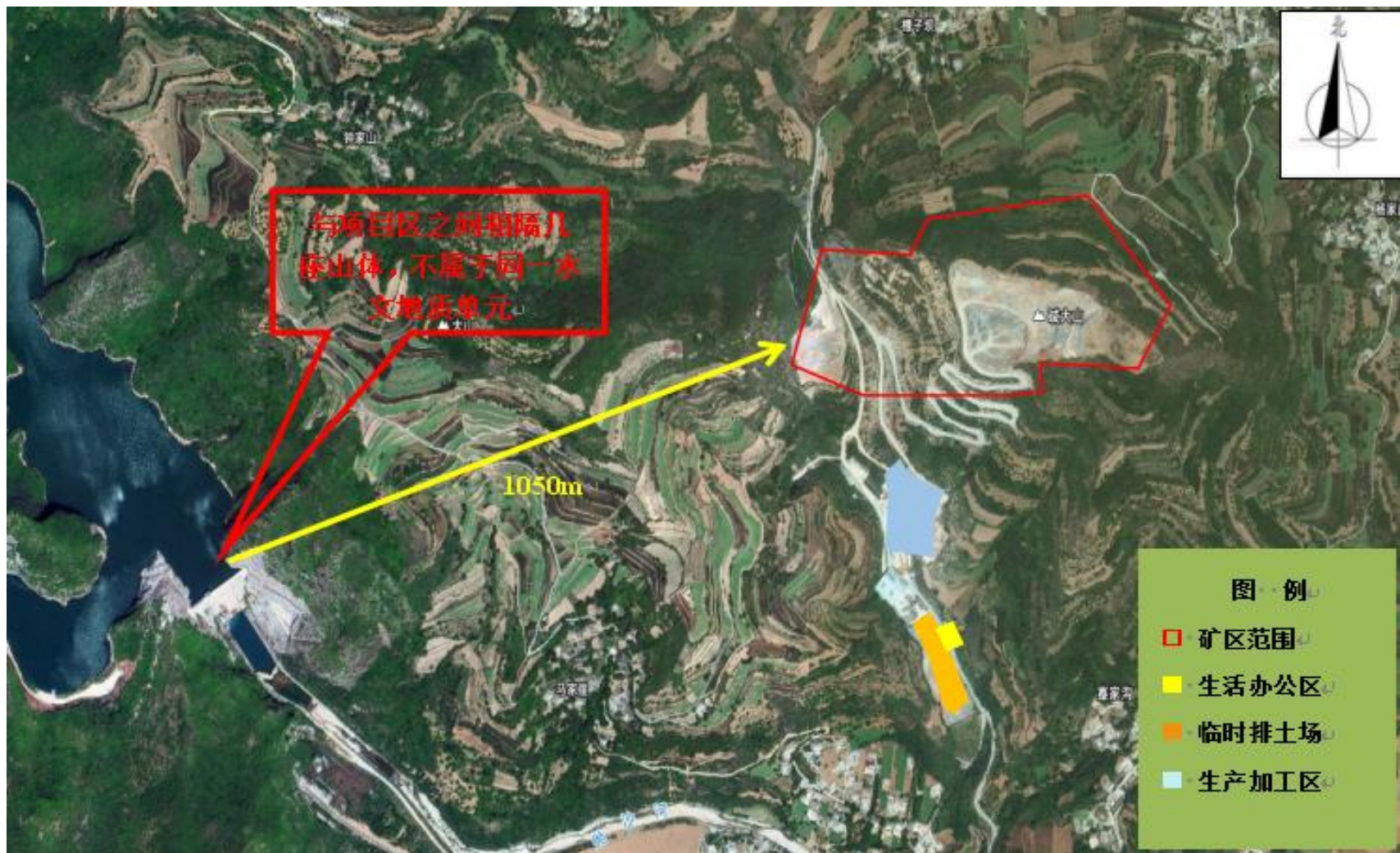
图4 项目与成县城区磨坝峡饮用水源地保护区位置关系图