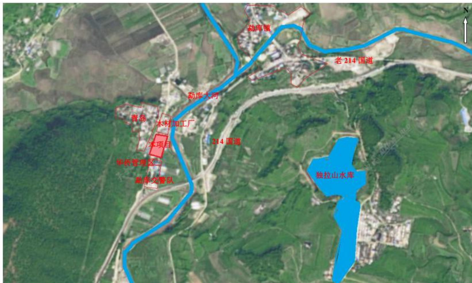
附图 4 项目周边关系图