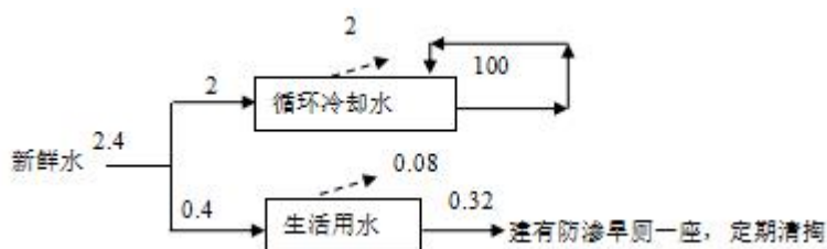
图 2-2 项目水平衡图单位：m³/d