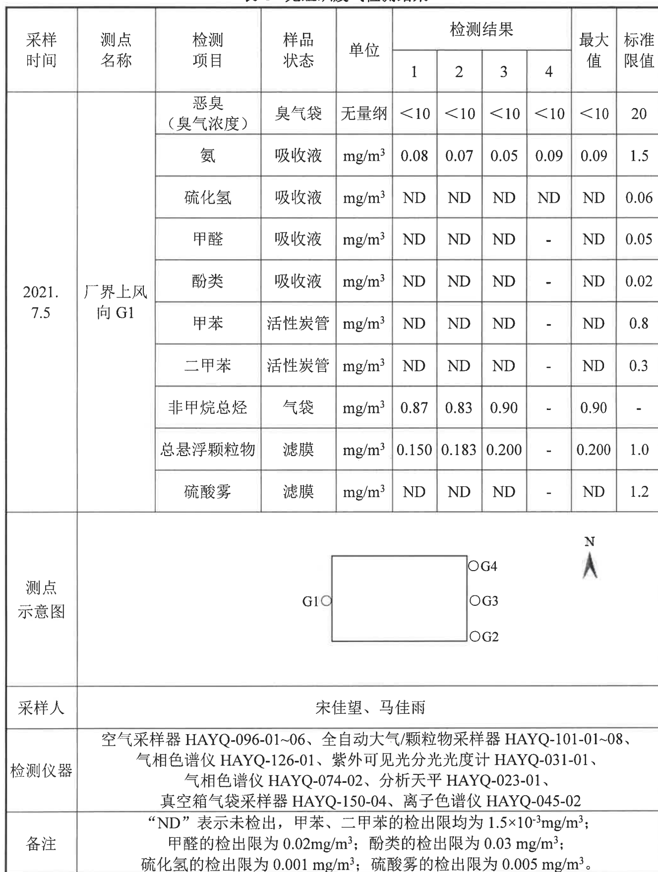
表 3 无组织废气检测结果