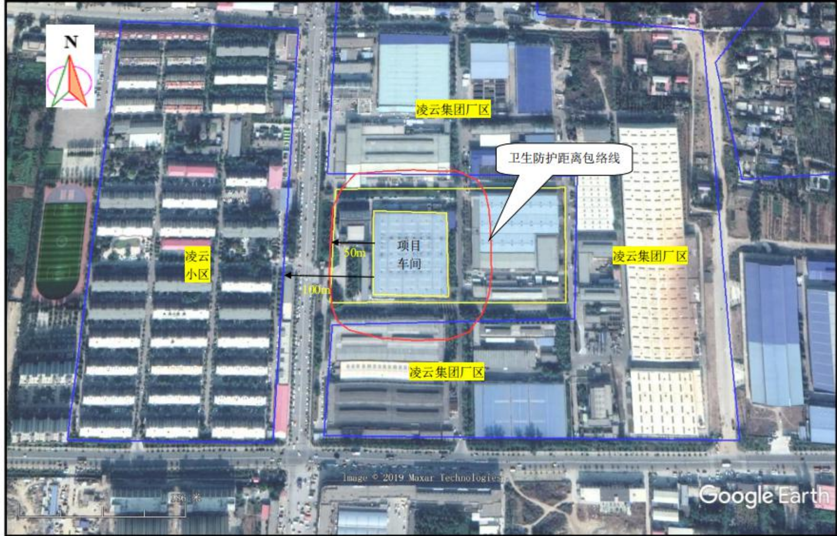
附图 4 项目卫生防护距离包络线图