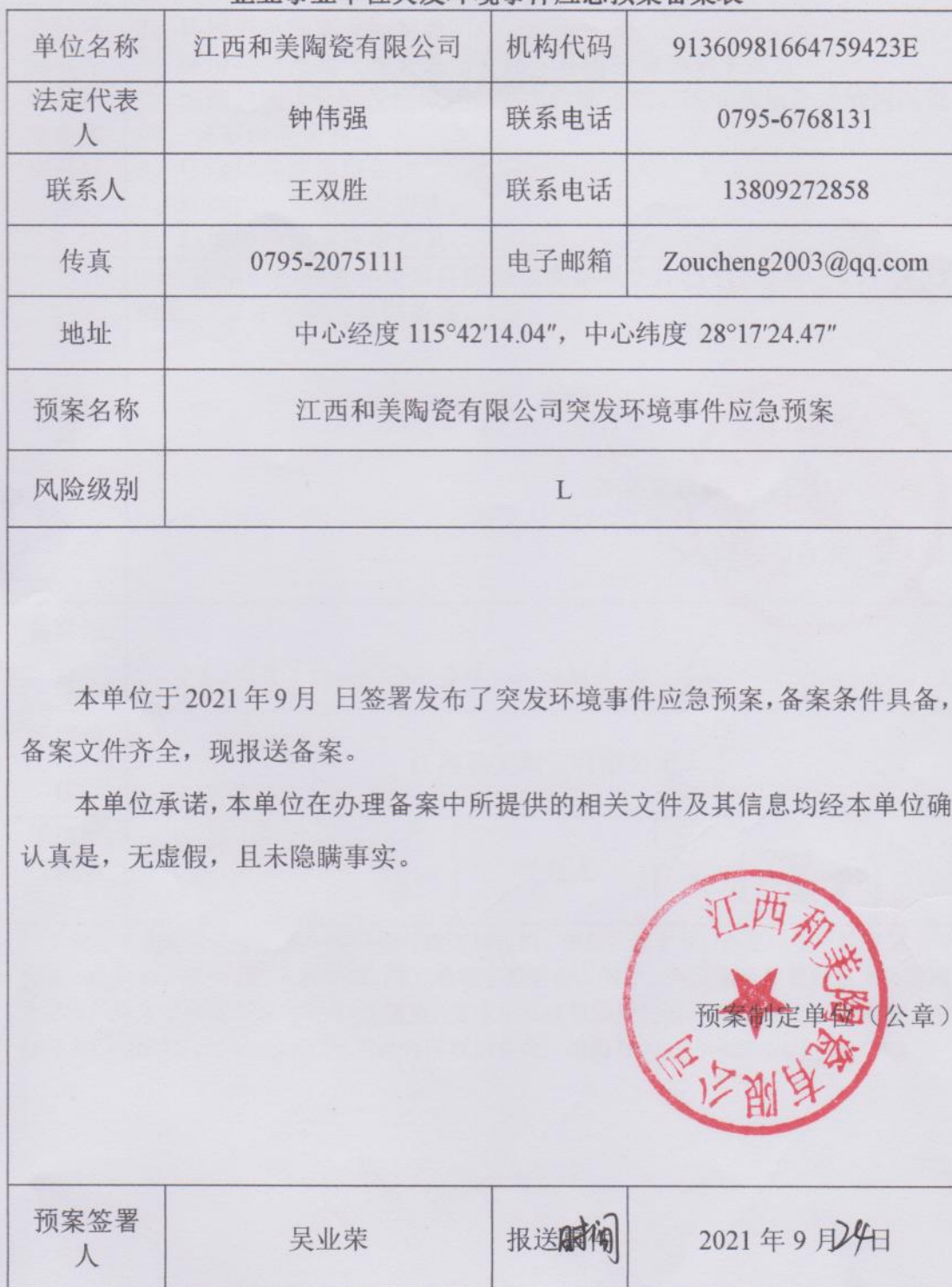
企业事业单位突发环境事件应急预案备案表