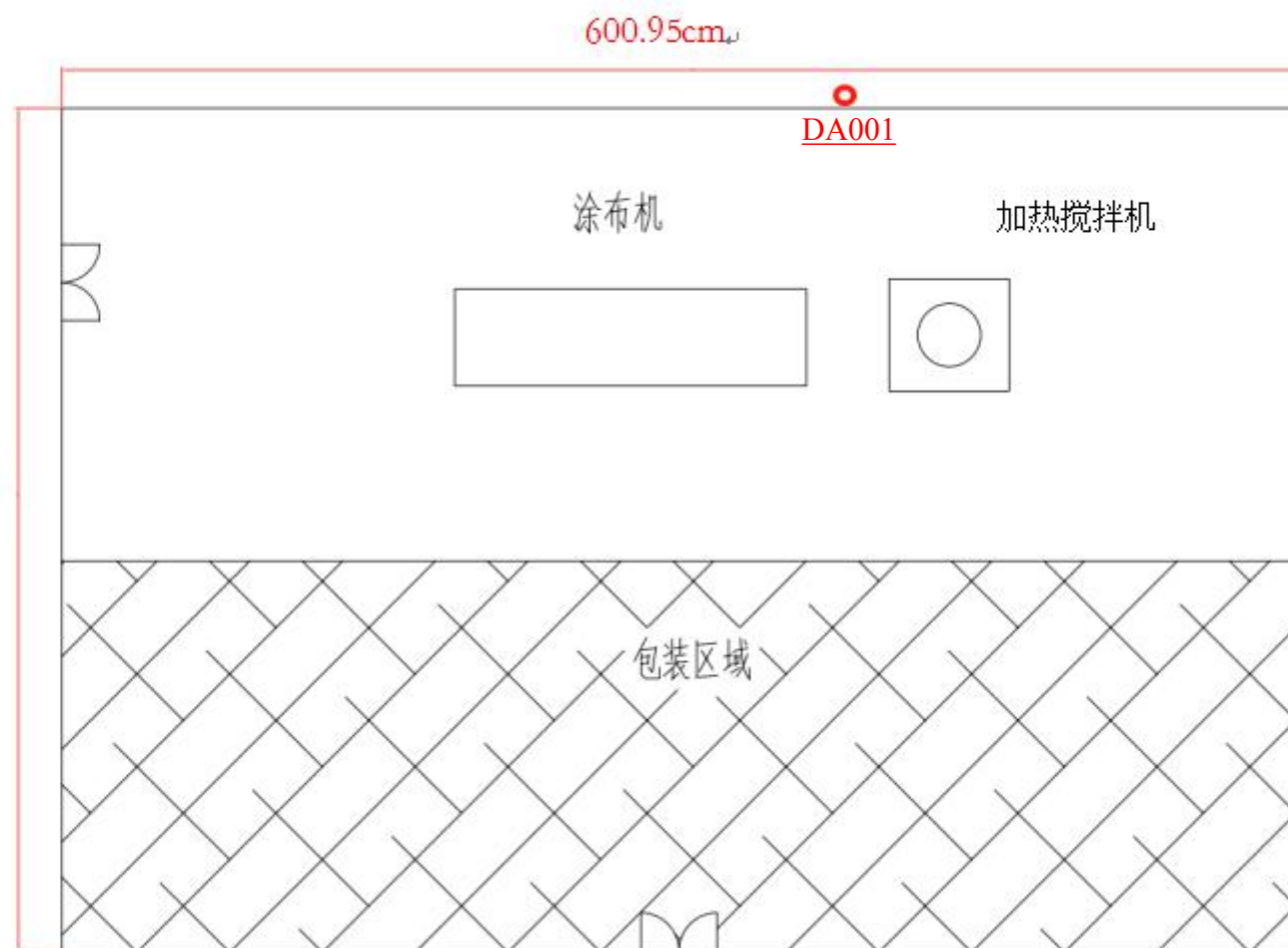
附图4 车间平面布置图