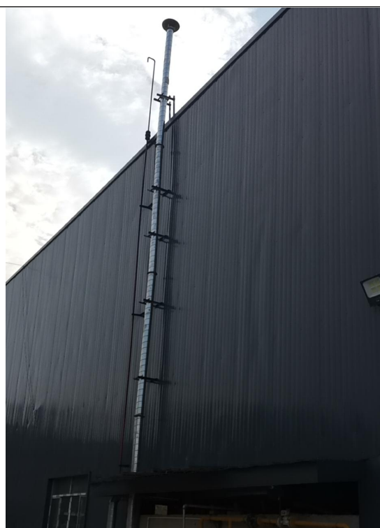
天然气锅炉排气筒