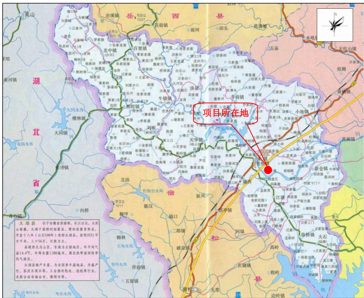
附图 1 项目地理位置图