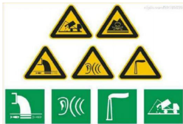
图4-3标准化排污口标志图

对厂内多种固体废物，应设置专用的临时贮存设施或堆放场地，并做好安全防护工作，防止发生二次污染。厂内临时贮存或堆放的场地应设置环保图形标志牌，做好防扬散、防流失、防渗漏、防雨的工作。