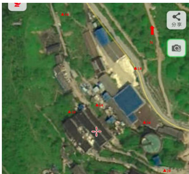
噪声监测点 (坪石选矿厂 1#~6#)