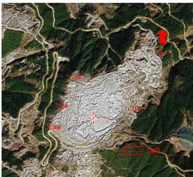
无组织废气检测点 (采矿场工业面)