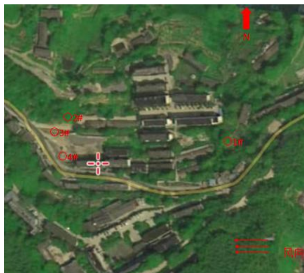
无组织废气检测点 (生活区)