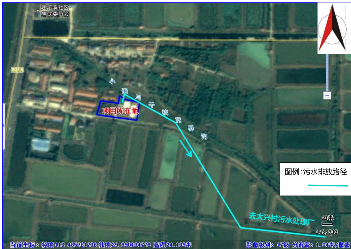
附图5 污水排放路径图