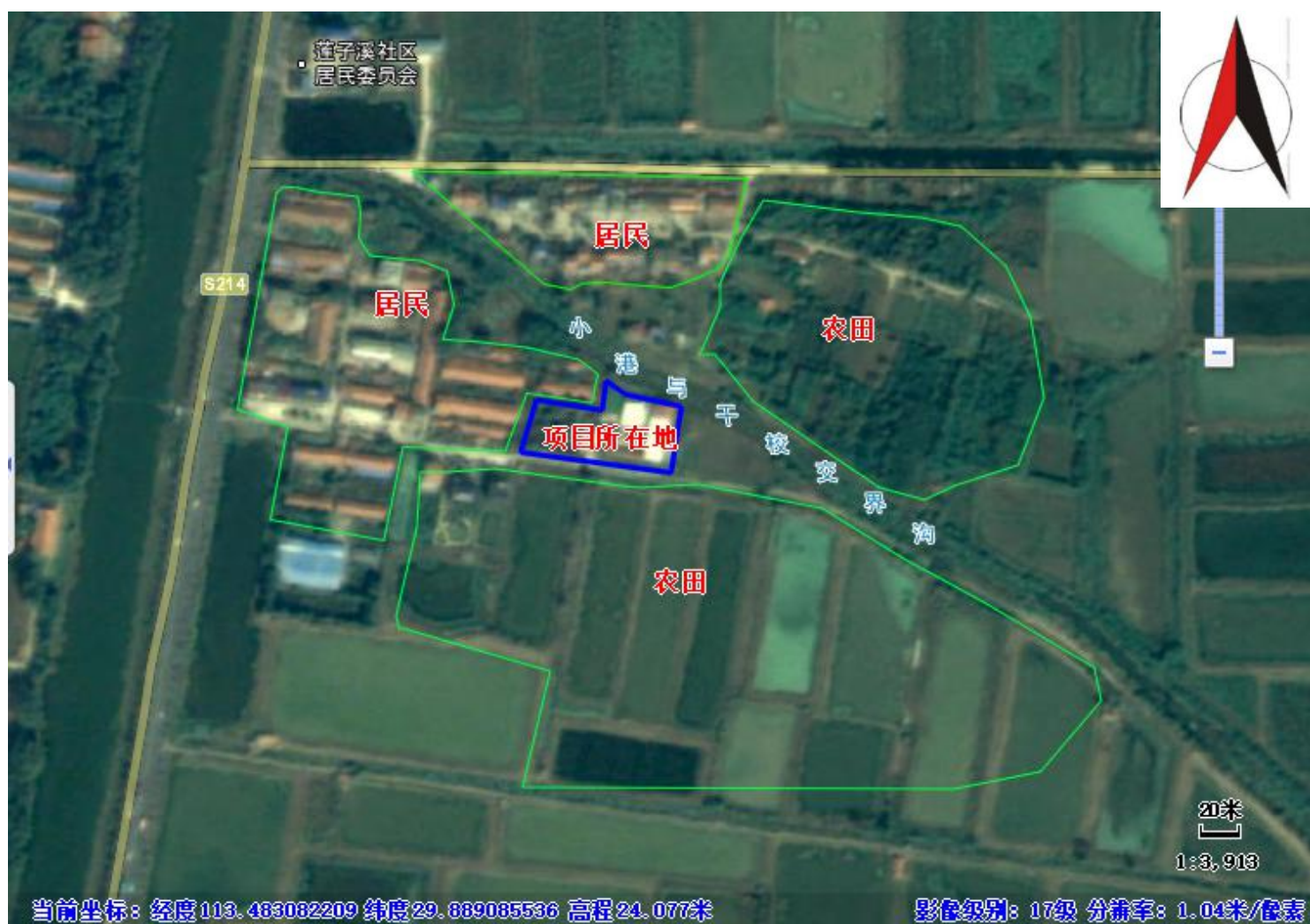
附图2 周边环境现状