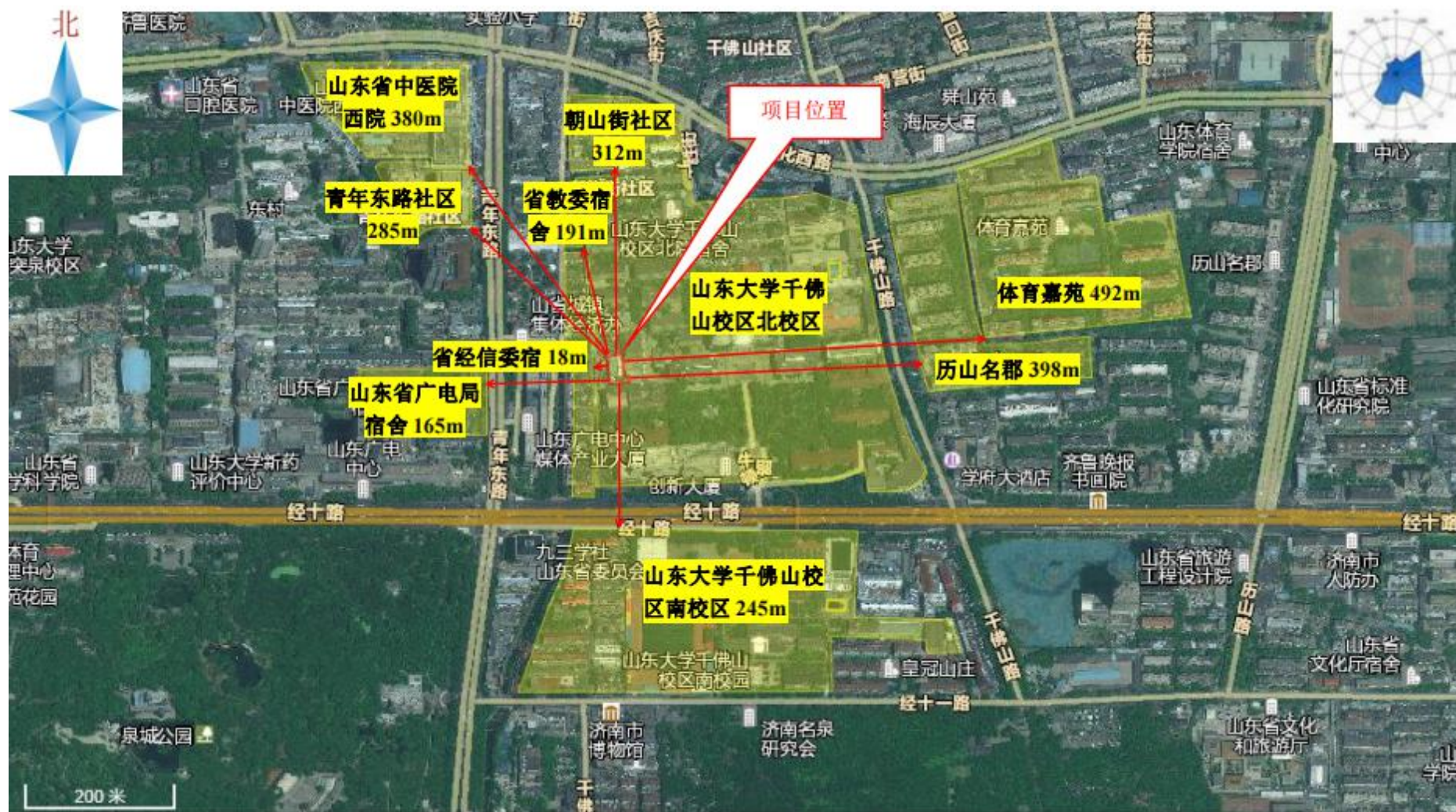
附图2 项目周边敏感目标分布图