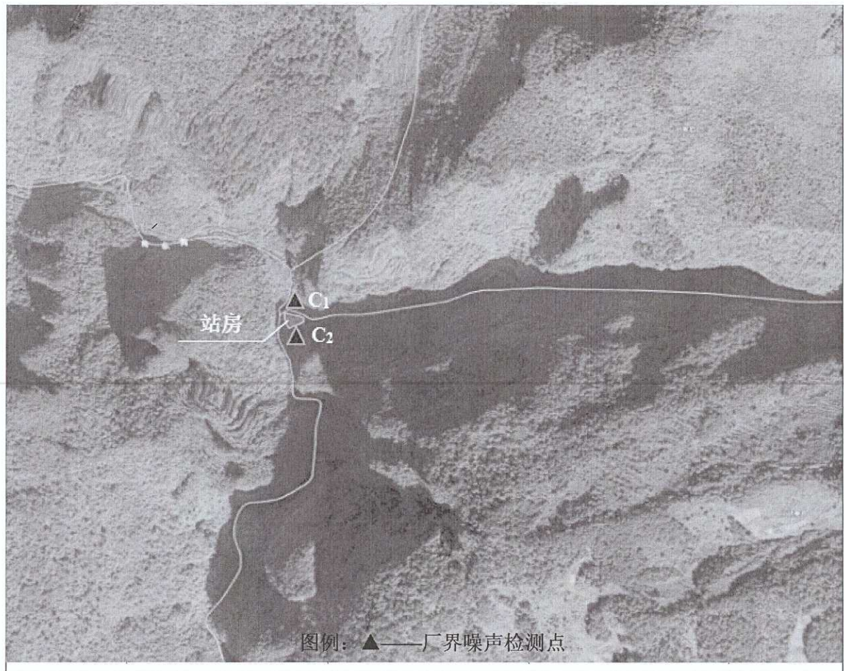
图 1 厂界噪声检测点位图