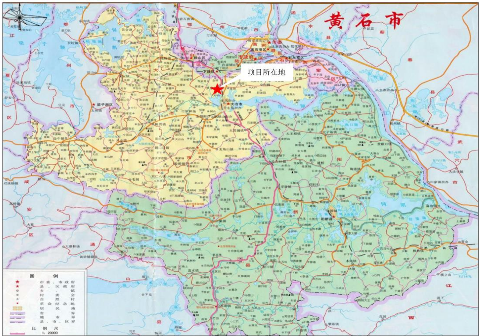
图一 项目建设地理位置