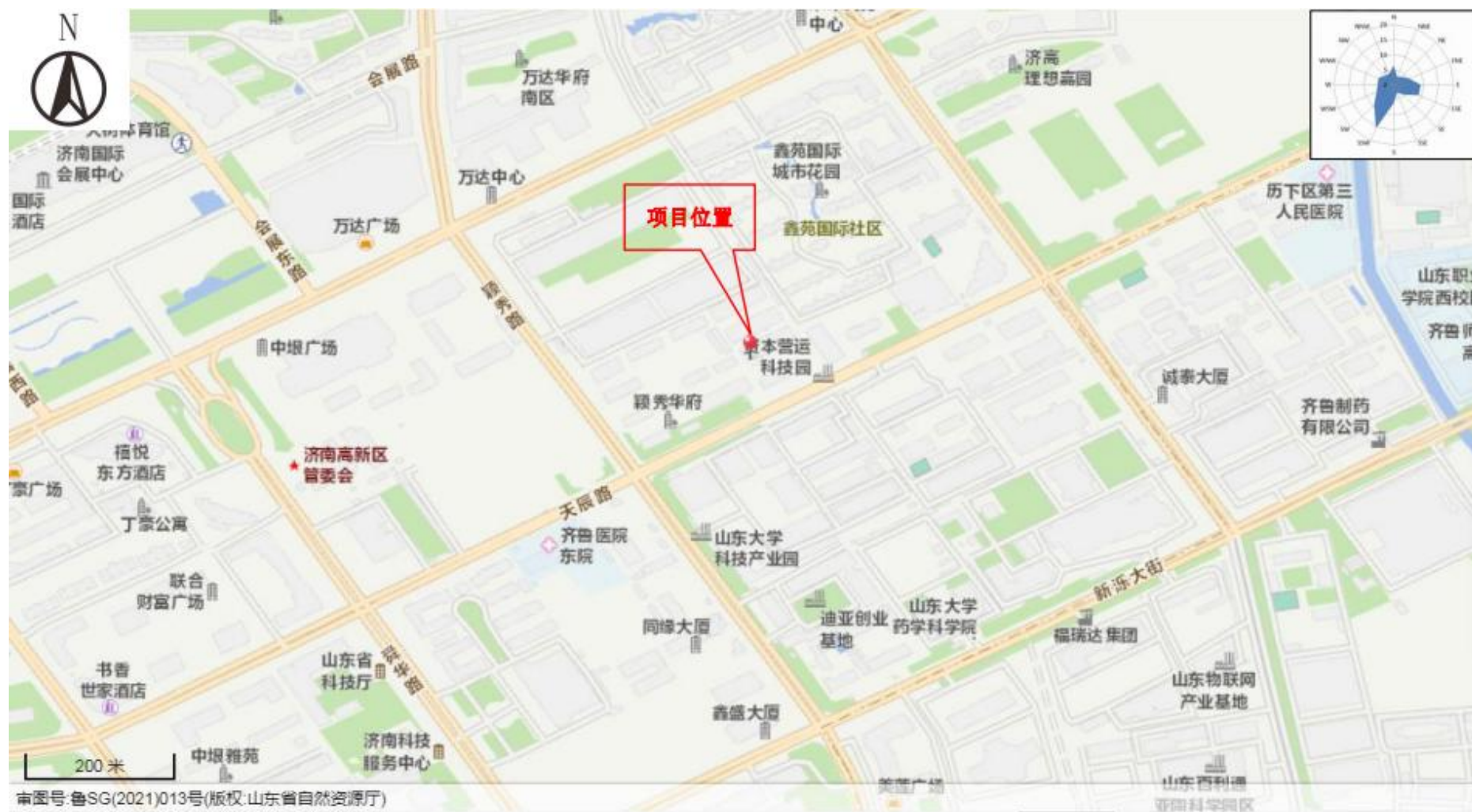
附图1 项目地理位置图