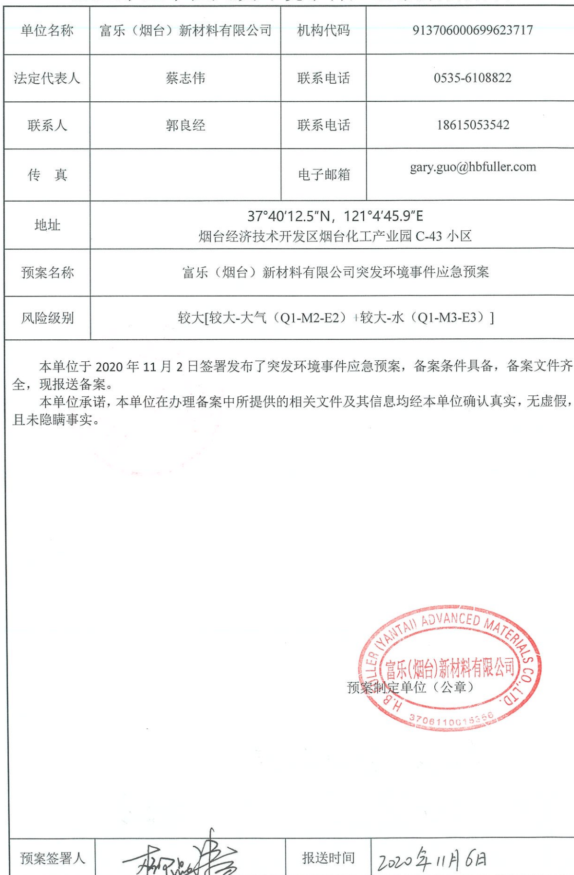
企业事业单位突发环境事件应急预案备案表